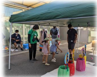
※小児がんなど難病の子どもと 家族のためのイベント開催費