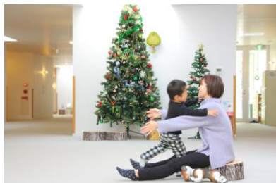
※ハウス入居中の子どもたちへ